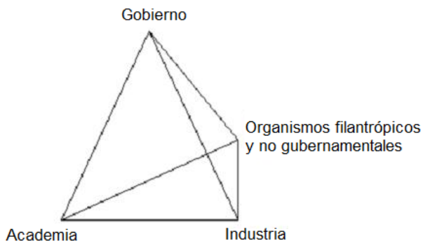
Imagen 3. Tetraedro de las posibles relaciones en la producción, el uso y la diseminación de nuevos conocimientos.

parte introductiva del artículo, pone en cuestión la modelización de las relaciones entre los diferentes organismos que han sido propuestos en la literatura académica, modelos que son comúnmente representados por un triángulo. Además, evocamos que la presencia de estos organismos, que calificamos como “filantrópicos” y “no gubernamentales”, ya ha sido abordada en diferentes investigaciones en las ciencias sociales. Es a partir de nuestras observaciones sobre el caso de los MEMS en México y apoyados en las otras investigaciones sobre estos organismos que proponemos extender el abanico de entidades a tomar en cuenta en este tipo de estudios. Para incluir a estos organismos como una cuarta esfera en los modelos de las relaciones proponemos la figura del tetraedro, donde cada vértice representa a cada una de las esferas y las aristas representan las relaciones posibles en los procesos de la producción, del uso y de la diseminación de nuevos conocimientos (ver imagen 3). Cabe mencionar que esta representación de las relaciones no significa que es necesario reunir las cuatro esferas institucionales para lograr la producción y aplicación de nuevos conocimientos.