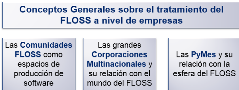
Figura 1. Bloques temáticos para la consideración económico-productiva del FLOSS

Por ello, se torna relevante un abordaje económico y productivo de la actividad del FLOSS, y este es el interés dominante que atraviesa este libro. El mismo es la culminación del proyecto de investigación PICT 2015-2703 “ Procesos de innovación en empresas de software libre y open source en Argentina ”, dirigido por el Dr. Hernán Morero, pero forma parte además de una investigación de mayor alcance alrededor de las particularidades económicas del FLOSS que comprende varios proyectos de investigación del equipo. 9 En este momento, el libro procura constituir un aporte para el abordaje académico del FLOSS desde la perspectiva económico-productiva actualmente ausente en la literatura en castellano. Para ello avanzaremos en cuatro bloques temáticos (Figura 1), desarrollados en los 4 capítulos siguientes.